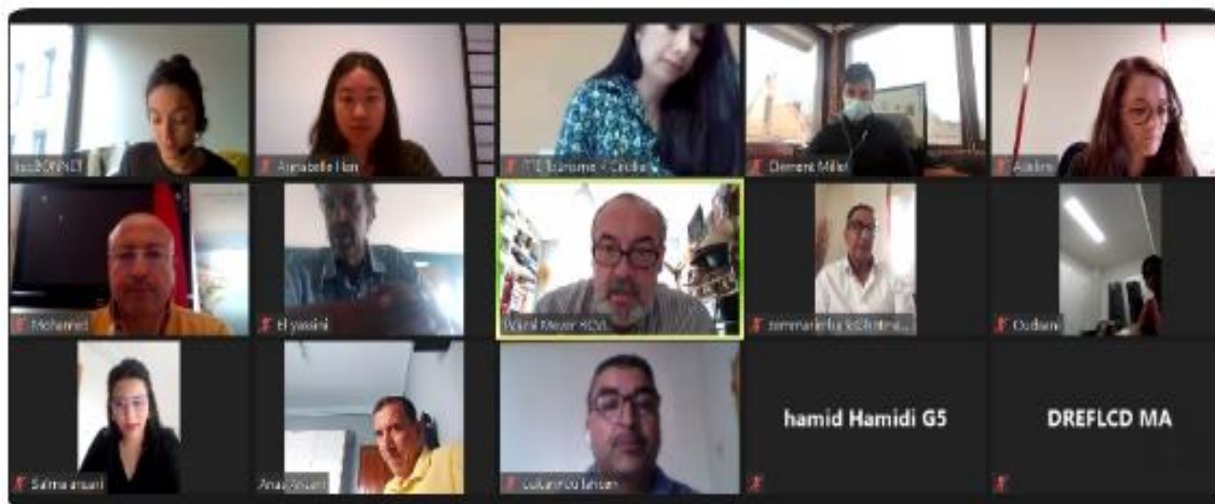
Réunion de lancement du Comité de suivi technique en octobre 2020

Nous vous l'annonçons lors de la précédente newsletter, les deux Régions sont lauréates du Fonds de soutien conjoint à la coopération décentralisée franco-marocaine avec le projet de développement du tourisme équestre dans la Région de Fès-Meknès. Avec l'ensemble des partenaires français et marocains, elles ont démarré le projet en octobre 2020 avec l'installation du Comité de suivi technique par visioconférence.