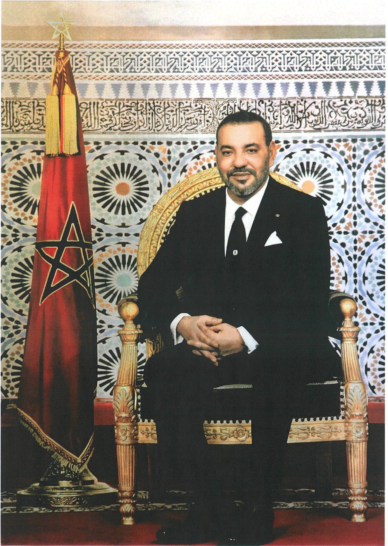
صَاحِبُ بَجْلَالَةِ الْمَلِكِ مُحَمَّدِ السَّنَادِيسِ نَصْرُهُ اللهُ