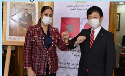
N. BOUCHAREB, ministre de l'Aménagement du Territoire National, de l'Urbanisme, de l'Habitat et de la Politique de la Ville et I. SHIGEKI, ministre japonais de l'Aménagement du Territoire, de l'Infrastructure, du Transport et du Tourisme

En marge d'une conférence internationale organisée par le ministère japonais d'Etat aux Territoires, Infrastructures, Transport et du Tourisme sur "les infrastructures de haute qualité et urbanisme", signature par le Maroc et le Japon d'un Mémorandum de coopération dans les domaines de l'aménagement du territoire, de l'urbanisme, de l'infrastructure et de l'investissement.