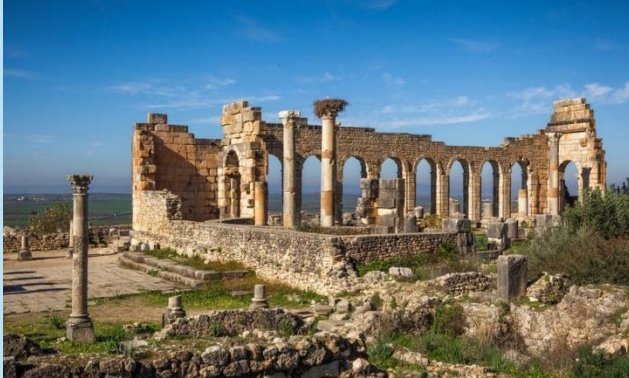
Site de Volubilis

Dans le cadre du Fonds des Ambassadeurs pour la préservation de la culture, don de 190.000$ du Département d'Etat américain à l'Association Ifker pour l'Éducation environnementale et le Développement Durable, basée dans la région Fès-Meknès , et ce, en soutien à un projet communautaire de conservation et de restauration d'une collection de mosaïques à Volubilis .