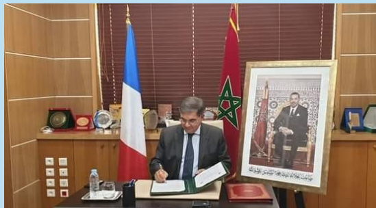
B. HAFIDI, Président de la Région Souss Massa signant la nouvelle convention cadre avec la Nouvelle Aquitaine

Signature d'un accord-cadre de coopération décentralisée 2021-2023 entre la région Nouvelle Aquitaine et la région Souss-Massa , qui porte sur la transition écologique des territoires et notamment les énergies renouvelables et l'éclairage public solaire et l'innovation au cœur des politiques économiques régionales. Il porte également sur le renouvellement et la diversification de l'offre touristique, la coopération universitaire entre les Universités Ibn Zohr et Bordeaux Montaigne ainsi que l'insertion économique des jeunes. Depuis 2002, la coopération entre les deux régions a permis notamment de créer une plateforme régionale de prêts d'honneur «Souss-Massa Initiative», et une Indication géographique protégée (IGP) autour de l'argan.