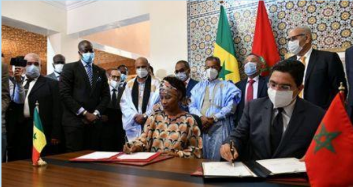
La Ministre des Affaires étrangères et des Sénégalais de l'extérieur, A Tall Sall et le Ministre des Affaires étrangères, de la Coopération africaine et des Marocains résidant à l'étranger, NBourita,

En marge de la cérémonie d'inauguration du Consulat général du Sénégal à Dakhla, signature par le Maroc et le Sénégal de 2 accords de coopération et un mémorandum d'entente destinés à promouvoir leur partenariat dans les domaines de la décentralisation, des technologies de l'information et de la communication et de l'aviation civile.