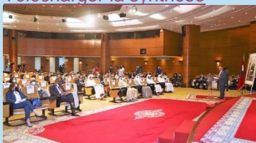
Le président de la CSMD, C. Benmoussa, devant le corps diplomatique accrédité au Maroc.

En mai dernier, présentation du rapport sur le Nouveau modèle de développement par la Commission spéciale sur le modèle de développement (CSMD), mise en place en 2019, et qui a travaillé depuis à partir d'une vaste consultation aux plans local, national et international. Le rapport identifie des axes stratégiques de transformation : une économie productive, diversifiée et créatrice de valeur et d'emplois de qualité, des opportunités d'inclusion pour tous et un lien social consolidé, un capital humain renforcé et mieux préparé pour l'avenir et un ancrage dans les territoires pour renforcer la résilience et la durabilité. Le secteur privé est érigé en levier de transformation, à travers notamment un « Pacte national pour le développement, qui se veut un moment de consensus et d'engagement des forces vives de la Nation autour d'une ambition et d'un référentiel partagés par tous ». Télécharger le rapport général Télécharger la synthèse