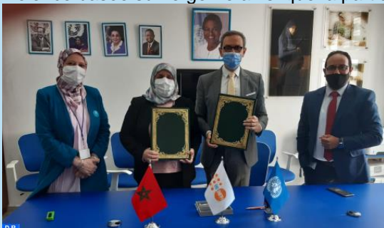
Les représentants du Collectif Autisme Maroc et du FNUAP

Signature d'un accord de partenariat entre le FNUAP et le Collectif Autisme Maroc visant l'élimination de la discrimination fondée sur le handicap et le genre, tout en mettant l'accent sur la promotion de l'accès à l'information, à l'éducation et aux services de santé de qualité, la prévention et la réponse à la violence basée sur le genre ainsi que la participation active des jeunes en situation de handicap.