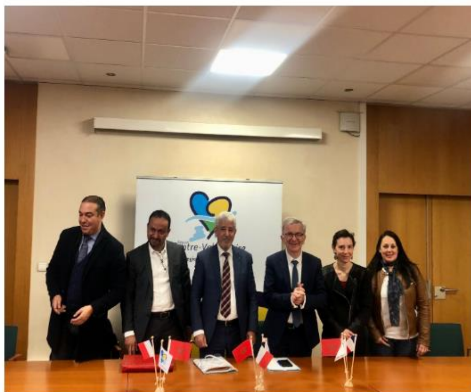
Réunion du Comité mixte de coopération le 28 mars 2022

La Région Centre-Val de Loire a accueilli une délégation de la Région Fès-Meknès conduite par le Président EL ANSARI, les 28 et 29 mars 2022.