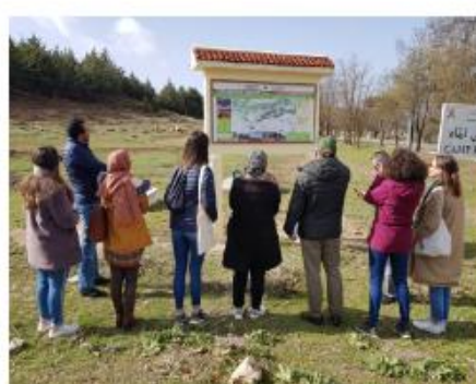
Délégation de la Région Fès-Meknès en région Centre-Val de Loire : visite du Parc fédéral équestre de la Fédération Française d'Equitation (Lamotte Beuvron)

La visite de la délégation au Parc Fédéral de la Fédération Française d'Equitation a permis de réitérer l'engagement et l'intérêt des deux Régions et de l'ensemble des partenaires pour le projet, de faire un point sur ses avancées mais aussi de développer les opportunités d'échanges entre les partenaires.